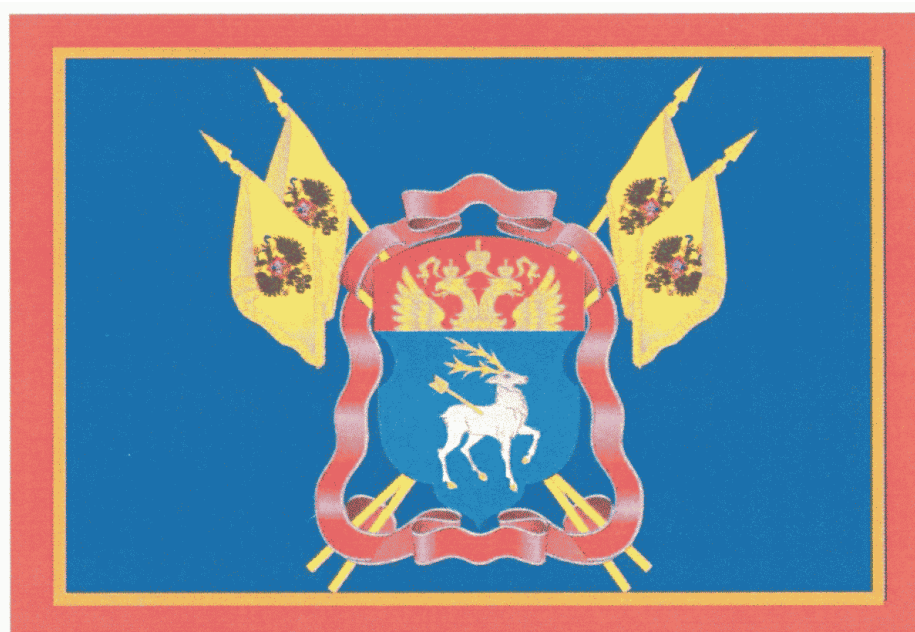
РИСУНОК ФЛАГА ВОЙСКОВОГО КАЗАЧЬЕГО ОБЩЕСТВА "ВСЕВЕЛИКОЕ ВОЙСКО ДОНСКОЕ"

Утверждено Указом Президента Российской Федерации от 14 октября 2010 г. N 1241