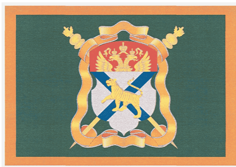
РИСУНОК ФЛАГА УССУРИЙСКОГО ВОЙСКОВОГО КАЗАЧЬЕГО ОБЩЕСТВА

Утверждено Указом Президента Российской Федерации от 14 октября 2010 г. N 1241