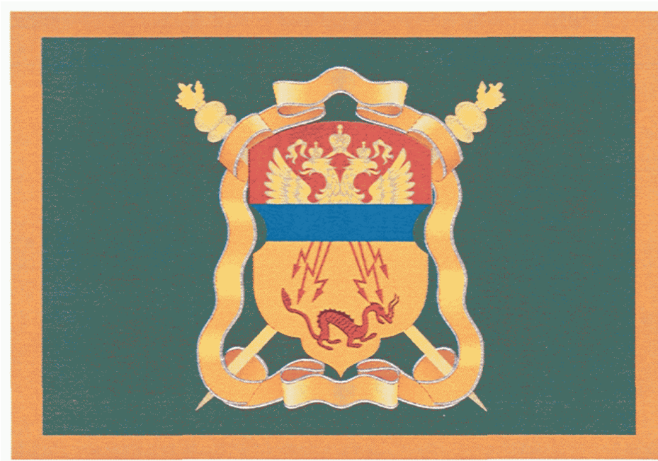
РИСУНОК ФЛАГА ЗАБАЙКАЛЬСКОГО ВОЙСКОВОГО КАЗАЧЬЕГО ОБЩЕСТВА

Утвержден Указом Президента Российской Федерации от 14 октября 2010 г. N 1241