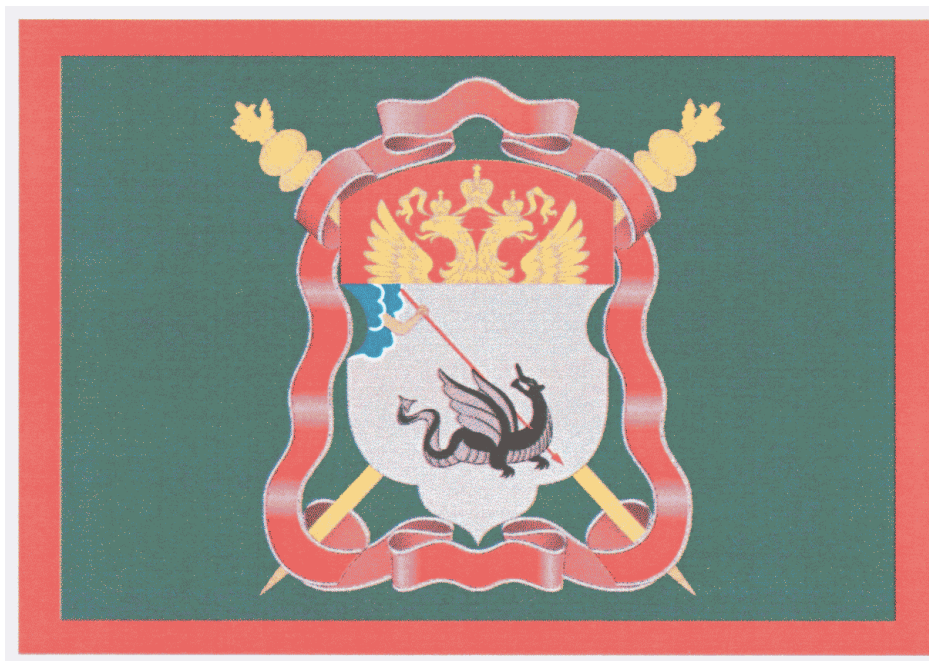
РИСУНОК ФЛАГА ЕНИСЕЙСКОГО ВОЙСКОВОГО КАЗАЧЬЕГО ОБЩЕСТВА

Утвержден Указом Президента Российской Федерации от 14 октября 2010 г. N 1241